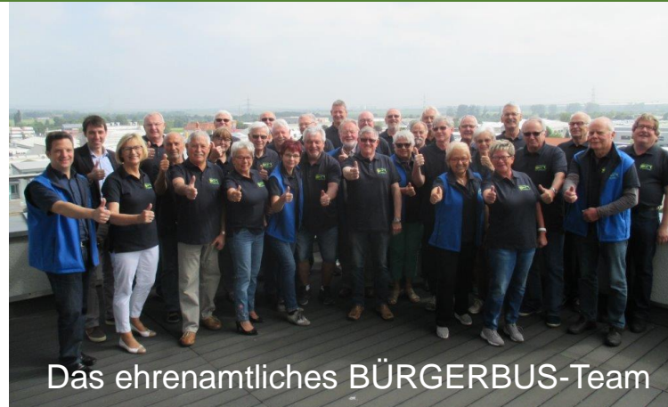
Das ehrenamtliches BÜRGERBUS-Team